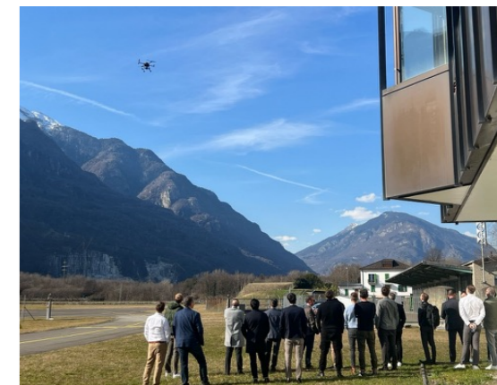
Demo di volo in aeroporto di Riviera durante la giornata di scambio con lo Swiss Aviation Cluster in marzo 2025.