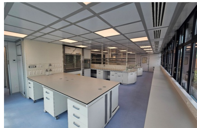
Interni di un comparto del laboratorio del quarto piano presso il Biomedical Hub di Bellinzona completamente rifatti

Parallelamente, il piano strategico quadriennale che puntava sulla creazione di una piattaforma tecnologica per il co-sviluppo di modelli in-vitro di tessuti umani (biofabbricazione) è stato consolidato. La mancanza di un consorzio industriale importante a supporto del programma di biofabbricazione ha portato alla decisione di non avviare subito gli investimenti per allestire il laboratorio e di procedere con un ulteriore consolidamento del partenariato privato, in grado di garantire un impegno anche finanziario per i primi anni di avviamento.