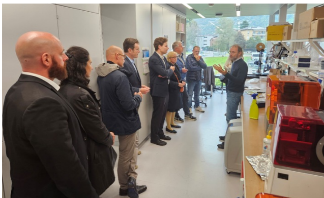
Visita del gruppo strategico dei direttori dei Parchi SI presso i laboratori di ricerca biomedica insediati nello stabile BIOS+ in Bellinzona.