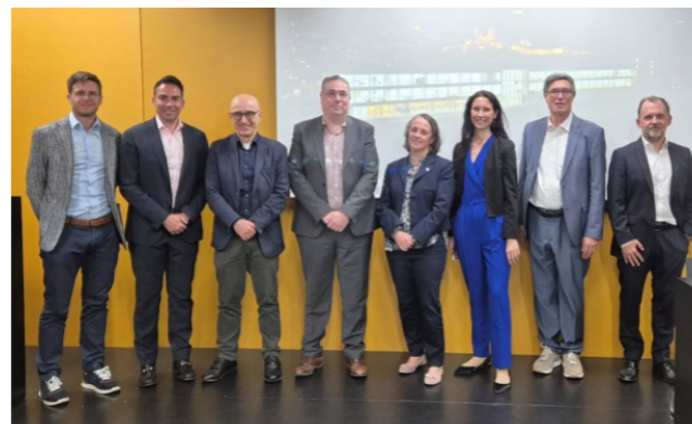
Visita della nuova squadra presidenziale dell'EPFL presso il BIOS+ in Bellinzona e relativi partner accademici.