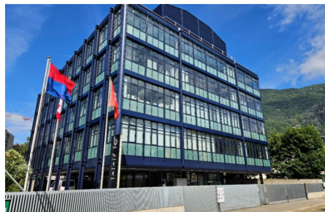
Biomedical Hub di Bellinzona a conclusione dei lavori di rinnovo degli spazi al quarto piano per la sede dei laboratori Life Sciences del SIP-TI.

Gli spazi ad uso esclusivo al quarto piano sono di 473 m 2 , comprendenti 249 m 2 di laboratori concepiti per attività di ricerca e sviluppo in ambito biotecnologico e ulteriori spazi ufficio e tecnici. Gli spazi laboratorio sono stati rinnovati in modo importante considerando le normative svizzere ed europee in ambito farmaceutico e dei dispositivi medici.