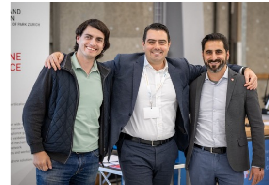
Team operativo dello Swiss Drone Competence Center in fiera

1062 m 2 Di superficie utile netta di uffici e spazi laboratorio già occupati al 100% da membri